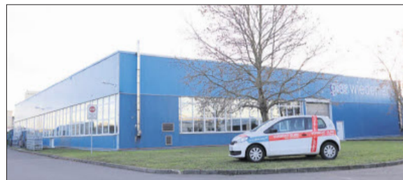
Das Werk für Glasproduktion in Thüringen.