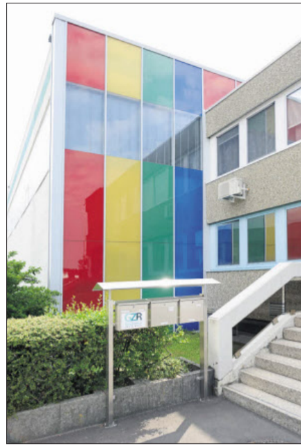
So bunt wie seine Produktvielfalt: das »GZR Glas-Zentrum Reutlingen«.