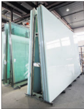
Großformatiges Glas gehört zum Portfolio des GlasZentrums.

Das ist ein Familienbetrieb mit Tradition: Vor rund 100