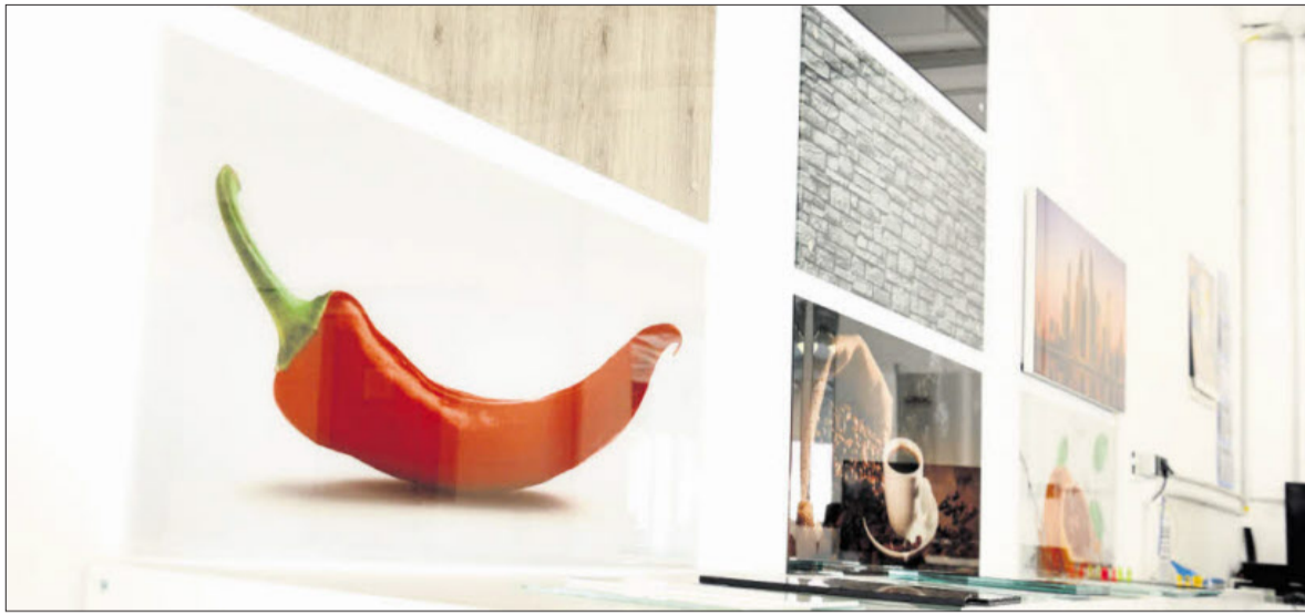
Fotoglaswände sind gefragte Dekorationselemente.