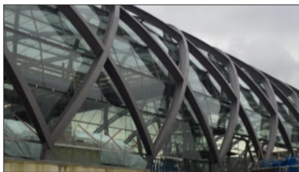
Das GlasZentrum Reutlingen sorgt für den Durchblick bei Großprojekten – wie beim 300 Meter langen ICE-Tunnel in Hamburg.