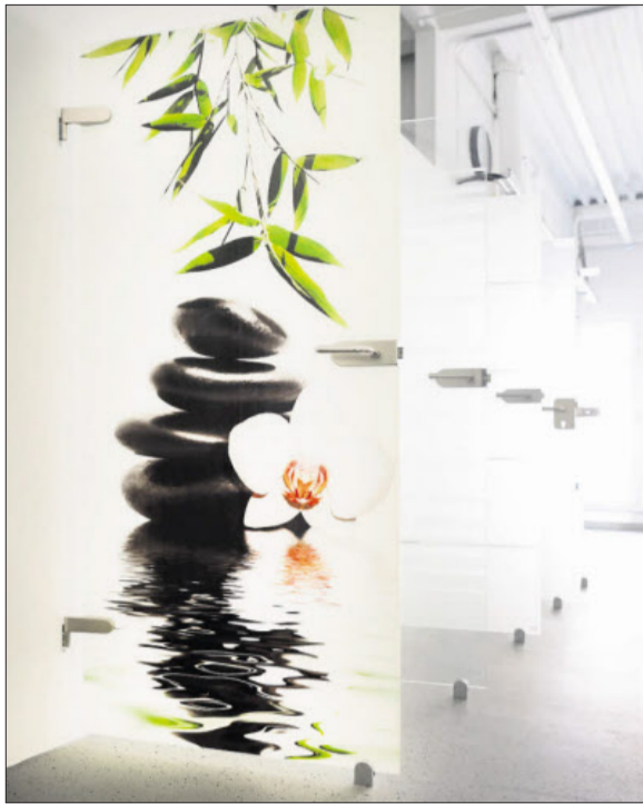
Fotoglas belebt jede Dusche.